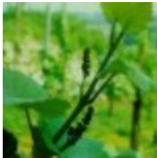
55 - Inflorescencia hinchada 15 - Inflorescencia hinchada G - Inflorescencia separada