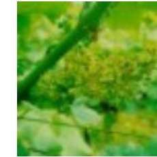
65 - Floración plena 23 - Floración plena I - Plena Floración