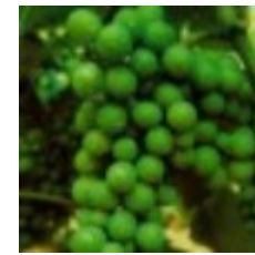
79 - Racimo cerrado 34 - Racimo cerrado