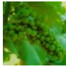
77 - Comienzo de cierre de racimo 33 - Comienzo de cierre de racimo