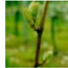
11 - 1ª hoja sin desplegar 07 - 1ª hoka sin desplegar D - Emergencia de Hojas