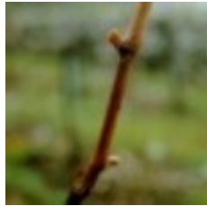
05 - Yema hinchada 03 - Yema hinchada B - Yema hinchada