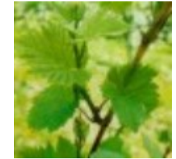
53 - Inflorescencia visible 12 - Inflorescencia visible F - Inflorescencia visible