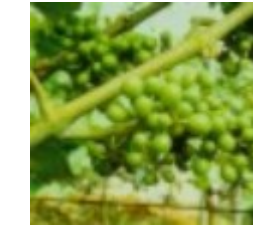
75 - Grano arveja 31 - Grano arveja