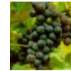
85 - Ablandamiento de bayas 36 - Maduración