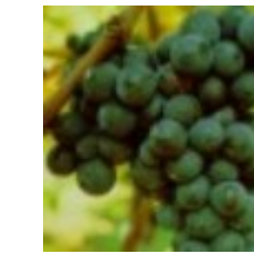
89 - Madurez de cosecha 38 - Madurez de cosecha