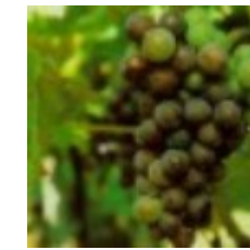
81 - Envero 35 - Envero