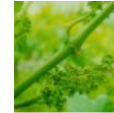
68 - 80% de caliptras caídas 25 - Final de Floración J - Cuaje