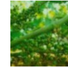
73 - Bayas de 3 mm 29 - Bayas de 3 mm