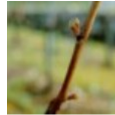
09 - Punta verde visible 05 - Brotación C - Punta verde