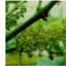
60 - Caída de primeras caliptras 19 - Comienzo de floración