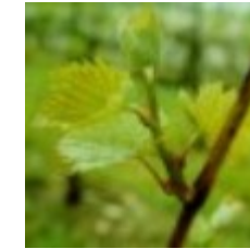
13 - 3 hojas desplegadas 09 - 2 a 3 hojas desplegadas E - 2 a 3 hojas desplegadas